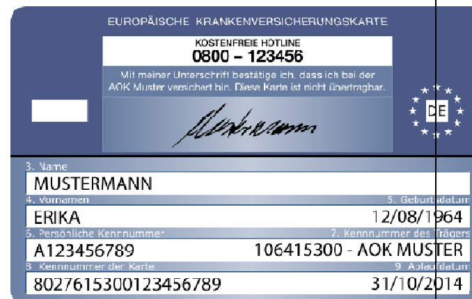
Szabvány (2) – a nemzeti kártya hátoldalán szereplő kártya